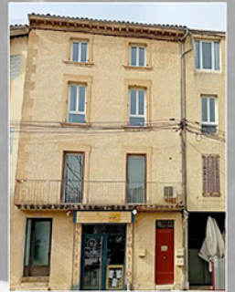
Photographie actuelle de l'ancien garage Fernand JEAN.