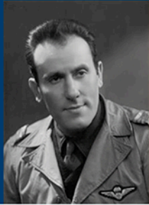
René CHAR - Capitaine Alexandre