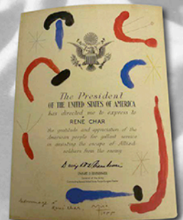
Certificat du général EISENHOWER, adressé à René CHAR, illustré par son ami Miro en 1955.