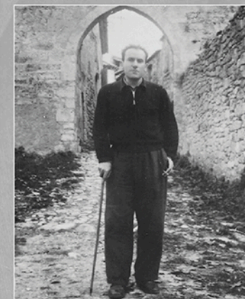
René CHAR à Céreste, hiver 1943.