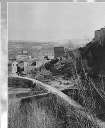
Chemin de la vieille fontaine.