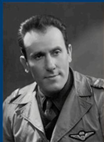
René CHAR - Capitaine Alexandre