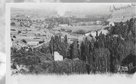
Carte postale ancienne de Céreste.

René CHAR découvre Céreste en 1936. Durant la guerre, la commune bas-alpine, idéalement située à proximité du Vaucluse, lui sert de refuge et de base arrière. Il y dispose de solides appuis parmi les gendarmes locaux et au sein de la famille Roux qui lui loue des bergeries vouées à l'accueil des premiers jeunes hommes fuyant le Service du travail obligatoire (STO). Il sait aussi pouvoir compter sur une partie des Cérestains hostiles à la Révolution nationale, qui lui témoignent leur solidarité le 29 juin 1944 lors de l'investissement du village par les hommes de la 8 e compagnie Brandebourg accompagnés de feldgendarmes.