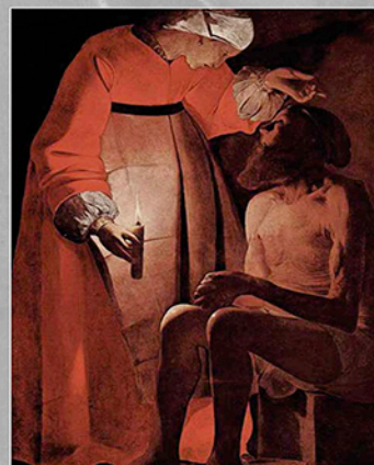
Reproduction du « Prisonnier de Georges de la Tour ».

« Je remercie la chance qui a permis que les braconniers de Provence se battent dans notre camp. La mémoire sylvestre de ces primitifs, leur aptitude pour le calcul, leur flair aigu par tous les temps, je serais surpris qu'une défaillance survint de ce côté. Je veillerai à ce qu'ils soient chaussés comme des dieux ! » Feuillet 79.