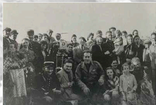
René CHAR à Céreste à la Libération.