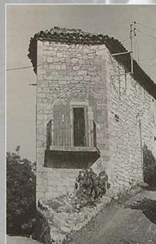
Poste de commandement de René CHAR.