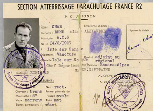
Carte d'appartenance de René CHAR au réseau SAP des Basses-Alpes.

Les œuvres complètes de René CHAR sont publiées aux éditions GALLIMARD.