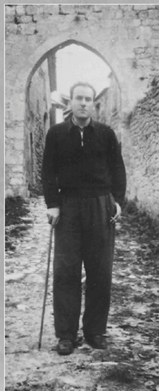
René CHAR après sa chute.

En 1944, la SAP des Basses-Alpes contrôle une dizaine de terrains d'atterrissage homologués par les Alliés. La réception des armes et du matériel impose de disposer d'un certain nombre de caches. Parmi celles-ci, la Tour des Guetteurs, des fermes comme «La Renardière» et la chapelle des Pénitents à Céreste. C'est dans le grenier de cette dernière que, le 16 mai 1944, René Char, établissant l'inventaire d'un lot de grenades, fait une grave chute, se fracture le bras et se démet l'épaule.