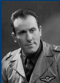
René CHAR - Capitaine Alexandre