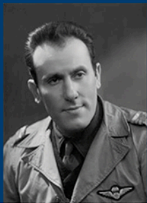
René CHAR - Capitaine Alexandre