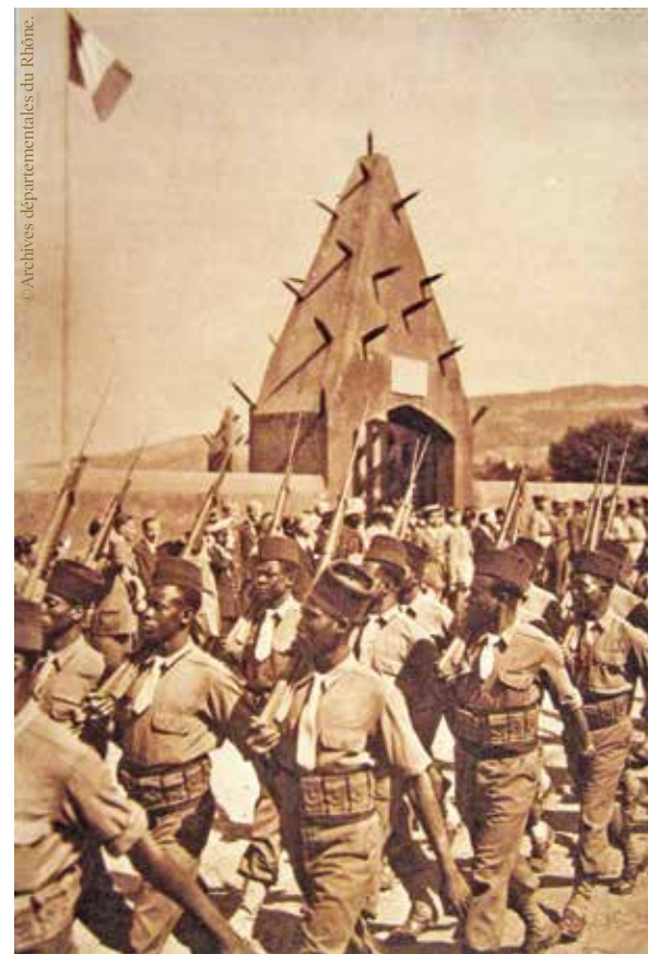
Tirailleurs de la Première armée française défilant devant le Tata sénégalais de Chasselay le 24 septembre 1944.